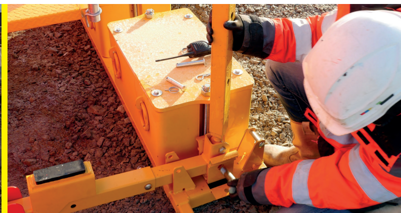
Une manipulation simple permet de fixer la béquille au lest de stabilité

Les banches SC 1015 Box RS de SATECO peuvent être utilisées avec les équipements de stabilité standards (portiques, stabilisateurs arrière au vent) et sont compatibles avec l'ensemble de la gamme SATECO. Enfin, le coffrage, comme les autres modèles de SATECO demeure personnalisable aux couleurs de l'utilisateur comme support promotionnel ou support d'information.