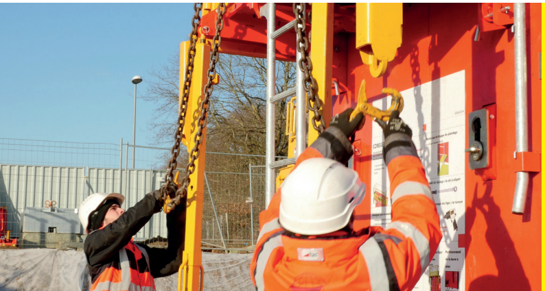
L'accrochage des élingues se fait au sol

La nouvelle banche SC 1015 Box RS inclut une multitude de « raccourcis » qui lui procure une utilisation aisée : la béquille dispose d'un verrouillage intégré, le portillon est simple de mise en oeuvre ou encore sa barrette d'about se fixe d'un seul côté. Les opérateurs évoluant au sol et non plus en hauteur, gagnent tant en sécurité, qu'en ergonomie.