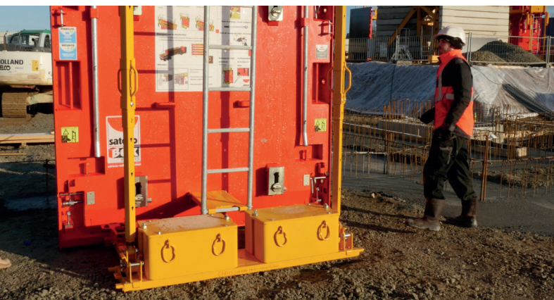
Le lest de stabilité est intégré

Lors de la mise en oeuvre du coffrage, un simple plug de la partie basse de béquille permet la stabilisation de la banche. Grâce à ses bras de manutention intégrés, l'élingage du coffrage devient d'autant plus facilité et ergonomique.