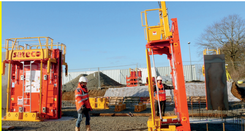
Manutention du train de banche avec stabilisateur intégré