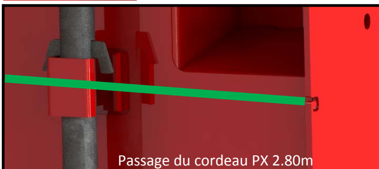
Passage du cordeau PX 2.80m