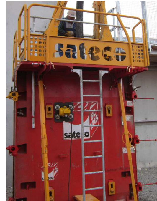
Fg le 27/11/13